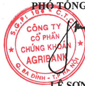
LÊ SƠN TÙNG